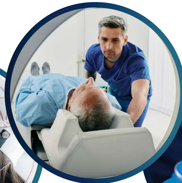
Radiologie und Strahlentherapie