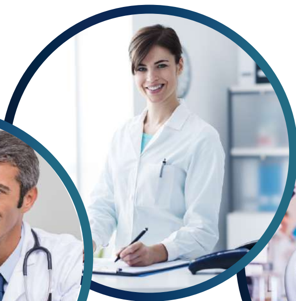
Kliniken / Chefärzte