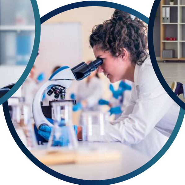
Labore / Laborgemeinschaften