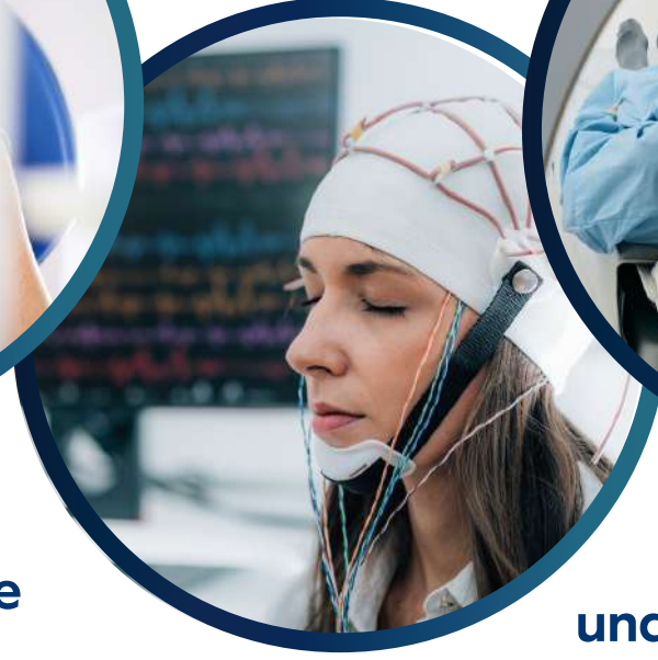
Neurologie und Neurochirurgie