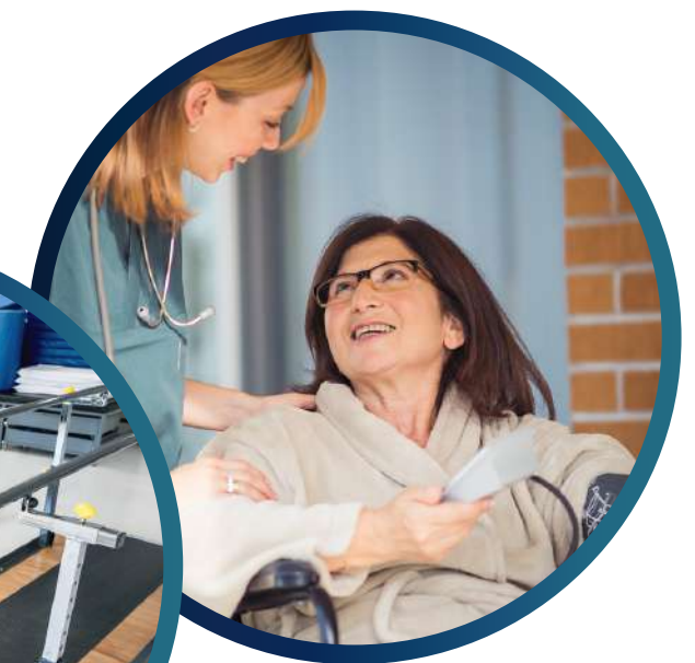
Pflegedienste & -einrichtungen