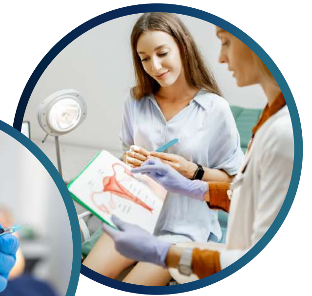
Gynäkologie und Kinderwunsch