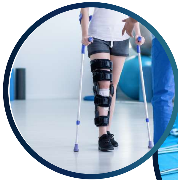
Orthopädie und Unfallchirurgie